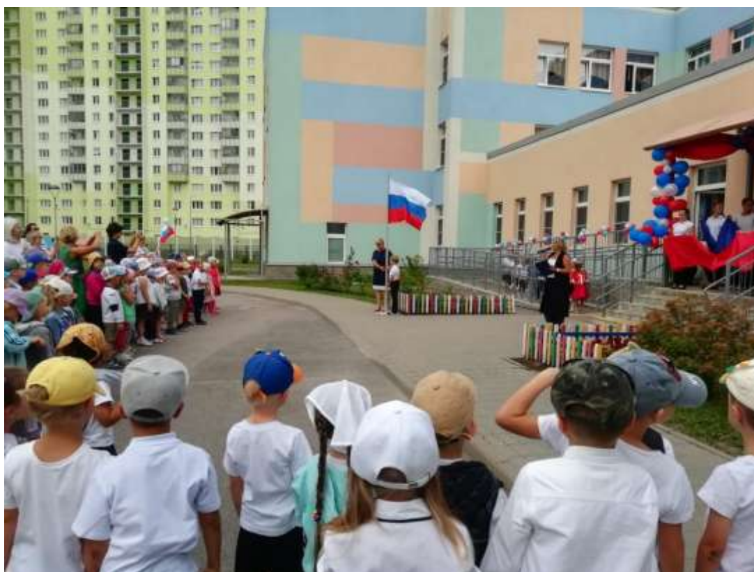
Фото демонстрация реализации сценария: