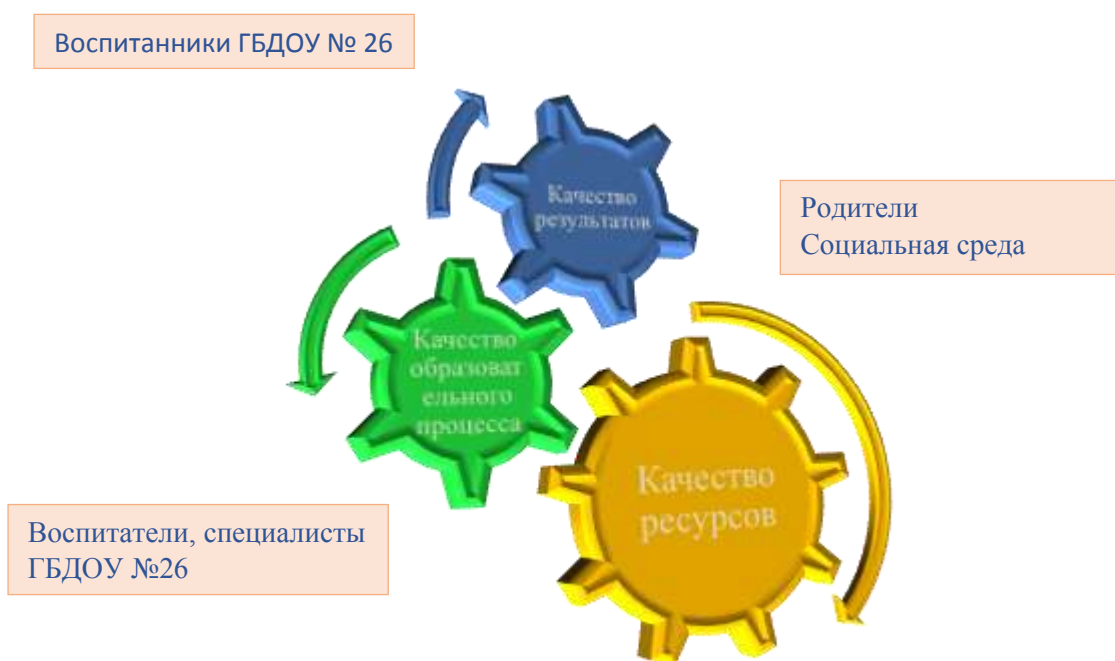
Рисунок 1. Грани качества инноваций в ГБДОУ №26.

Так как приоритетная направленность ГБДОУ №26 – здоровьесбережение и познавательное развитие дошкольников , следует позаботиться о высоком качестве как самого этого процесса, так и о его результативности в глазах общественности. (Рис. 1)